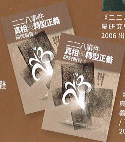
《二二八事件真相與轉型正義研究報告》上/下二冊，本會2021出版。