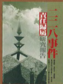
《二二八事件責任歸屬研究報告》，本會2006出版。

2 二二八研究目前已有一定成果，或許仍有部分史料尚待清查，也有諸多課題仍值得深入探究，但對於歷史的責任並不會難以辨明。然而如果只將論述停在「開放檔案、還原真相」，而忽視現已開放的檔案及歷史真相的研究，那就只是逃避歷史的藉口。